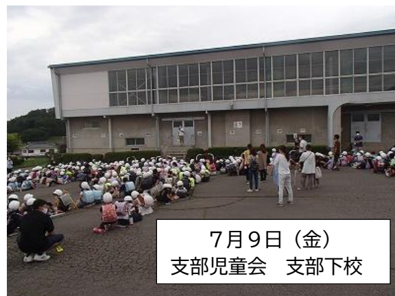
7月9日(金) 支部児童会 支部下校

※ 上記以外の日や勤務の時間外については市役所に電話をしていただくようお願いします。(小諸市役所 22-1700)